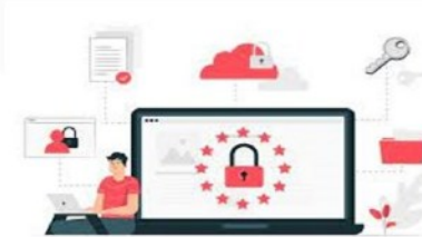
Utilisation et divulgation d'informations, photos, vidéos personnelles