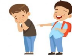
Moqueries, insultes, culpabilisation en lien avec un handicap