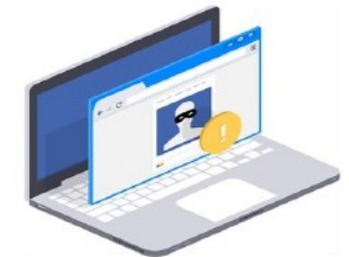
Diffusion de rumeurs et usurpation d'identité

Signalez le cyberharcèlement sur les réseaux sociaux à l'Espace Maroc Cyberconfiance