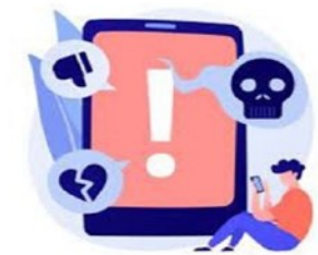
Intimidation et messages haineux à caractère religieux