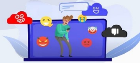
Insultes, menaces, moquerie