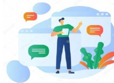
Commentaires à caractère sexiste